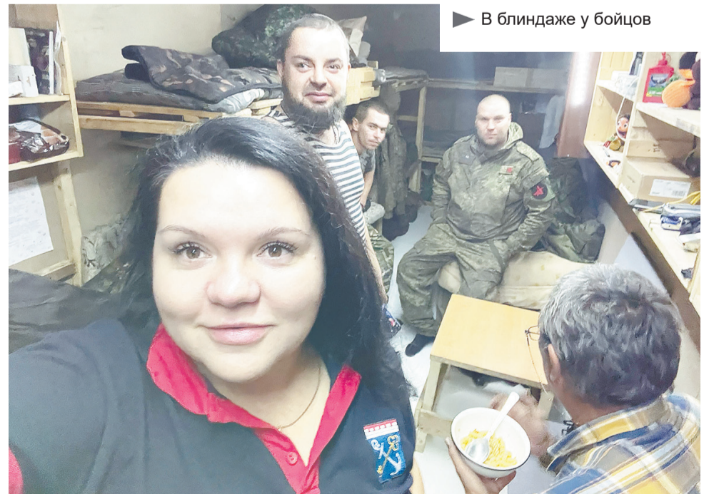
► В блиндаже у бойцов

В Шебекино мы остановились в центре. Жизнь тут лилась спокойно и размеренно, несмотря на то, что двадцать часов назад город попал под обстрел, было уничтожено несколько объектов инфраструктуры: пекарня, несколько частных домовладений, частично пострадал рынок. Нам навстречу выехали бойцы из Подпорожья и посёлка Вознесенье. Передали бойцам необходимое – генератор, медицинские товары. Земляки