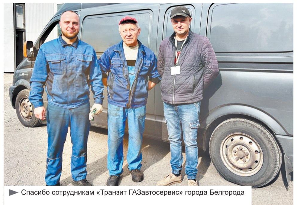
► Спасибо сотрудникам «Транзит ГАЗавтосервис» города Белгорода

К полудню наша «ласточка» была отремонтирована. За это огромное спасибо я выражаю руководству и коллективу технического центра «Транзит ГАЗавтосервис» в Белгороде. Нас починили быстро и не взяли платы, узнав, что мы волонтеры фронта. Пусть планы и были скомканы, с хорошим настроением мы снова двинулись в путь.