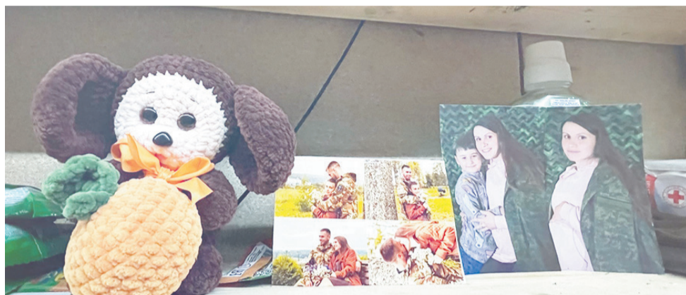
► Фото родных и любимых напоминают о доме