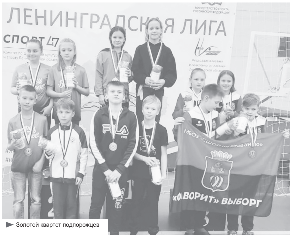
► Золотой квартет подпорожцев