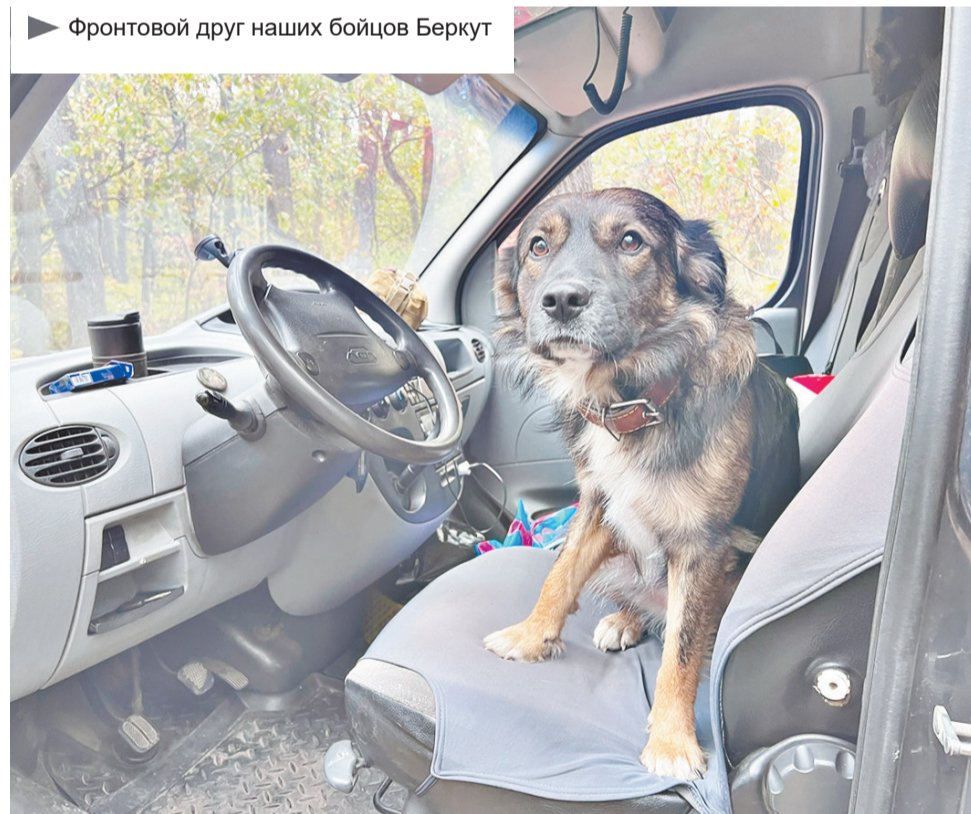
► Фронтной друг наших бойцов Беркут

Утром блиндаж несколько раз содрогался от сильного шума. Рядом наши работали «Градами».